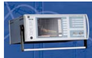
TDEMI 30M (9 kHz - 30 MHz)

basierten Filterbank wird das Signal an mehreren tausend Frequenzpunkten parallel verarbeitet. Das TDEMI 30M ist speziell für leitungsgebundene Emissionsmessungen von 9 kHz bis 30 MHz vorgesehen und ermöglicht es, eine Quasipeak-Messung in Band B oder Band A innerhalb von ca. 12 s durchzuführen. Eine komplette Messung Band A, B mit Quasipeak und Average dauert inklusive Eigenkalibrierung des TDEMI weniger als 55 s pro Leiter. Das TDEMI verfügt optional über eine Preselection für Band A sowie eine Ansteuerung der Netznachbildung (LISN). Auch das TDEMI 1G, welches den Frequenzbereich von 150 kHz bis 1 GHz abdeckt, kann mit einer Option für den unteren Frequenzbereich bis 9 kHz erweitert werden. ■