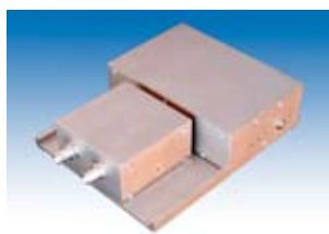
DOtech Type M Grundmodul - kann mit verschiedenen Aufsätzen kombiniert werden

EMV-Prüfungen im Automobilbereich stellen an die Emissions- und Störfestigkeitsmessungen extreme Anforderungen. Dies gilt auch für die Messtechnik zur Überwachung der Prüflinge bzw. zur Stimulation während der Prüfungen.