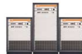
Mikrowellenverstärker in Halbleitertechnik von AR RF/ Microwave Instrumentation

Während TWT-Verstärker oft die gesamte erforderliche Leistung aus einer einzelnen Röhre ziehen, nutzen Halbleiter-Verstärker dutzende, wenn nicht hunderte von Transistoren. Dabei steht dem Entwickler eine große Vielfalt von leistungsteilenden und -kombinierenden Technologien und Architekturen zur Verfügung. In der ausführlichen Version dieses Beitrags werden die Vorteile und Nachteile verschiedener Verschaltungstechniken diskutiert. Der ausführliche Beitrag kann unter www.emvgmbh.de -> emv Aktuell heruntergeladen werden. ■