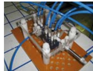
pneumatische Steuerung zur Fernsteuerung eines Joysticks

Mit der zugehörigen Software können Befehlsfolgen (z.B. aufeinander folgende Betätigung von Tastern und Potentiometern) als Skript definiert, gespeichert und abgerufen werden. So können in den Prüfungen immer wiederkehrende Abfolgen wie z.B. ein Schaltvorgang im Fahrzeug (Kupplung treten, Gas wegnehmen, manuelle Schaltung bedienen, Kupplung lösen, Gas geben) gespeichert und per Mausclick aufgerufen werden. Das Remote Control System von hf-technologie ist flexibel konfigurierbar und kann für vielfältige Anwendungen adaptiert werden. Eine mögliche Anwendung zeigen wir Ihnen auf der EMV in Stuttgart. ■